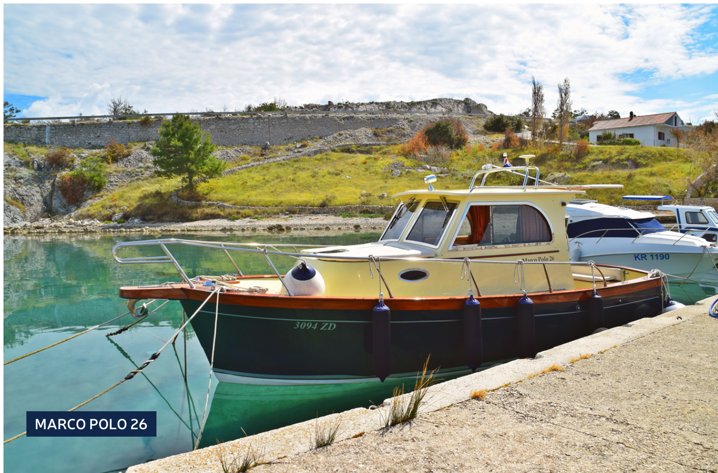
MARCO POLO 26